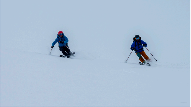
Skifahren is des leiwandste.... (s. z.B. 31.01.-02.02/31.01.-03.02)

schluss fallen Stornokosten an, sollte der Platz nicht über die WL vergeben werden können. 10€ / Nacht und Person. Ich freue mich auf euch!