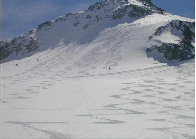
Pigne d'Arolla (s. 28.04.-01.05)

Spaltenbergung, ausreichend Kondition (Höhe!), sichere Aufstiegs- und Abfahrtstechnik.