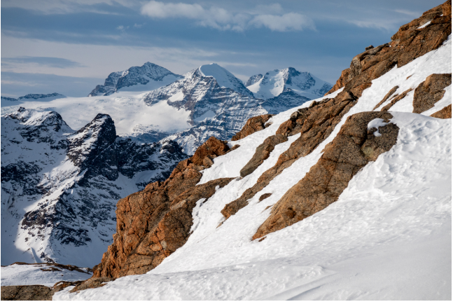
Mögliche Ziele im Val Viola! (s. 23.03.-30.03.)