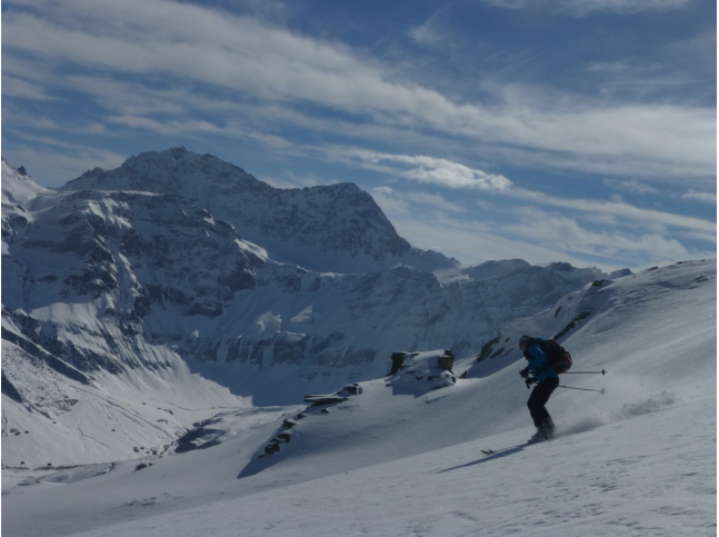
Im Safiental (s. 20.02.-24.02.)