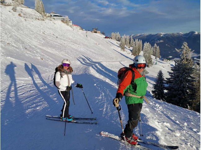
Am Brauneck (s. 07.01.)