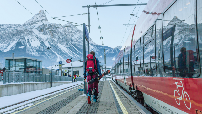
Auf gehts zur Skisafari – natürlich mit Öffis! (s. Vortrag am 10.12.)