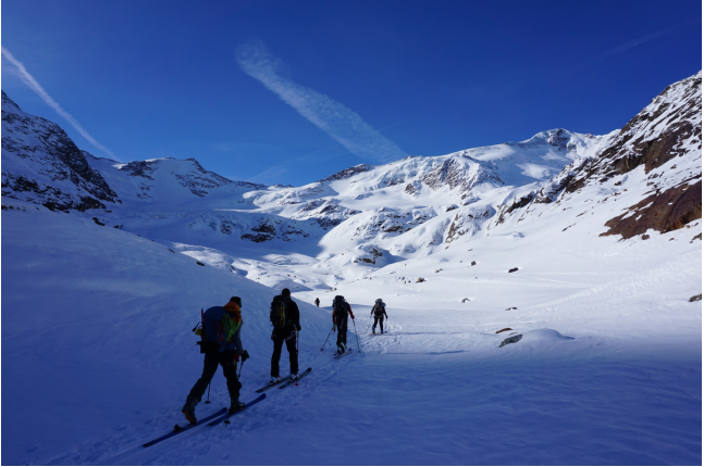
Morgendlicher Aufstieg im Fornokessel (s. 04.04.-09.04.)