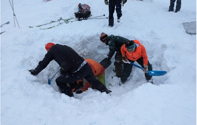
Jede Sekunde zählt... Schaufeln, Schaufeln, Schaufeln (s. z.B. 07.02.-09.02.)