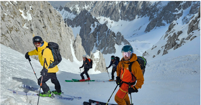
In der Goinger Scharte über'm Griesner Kar (s. 30.03.)