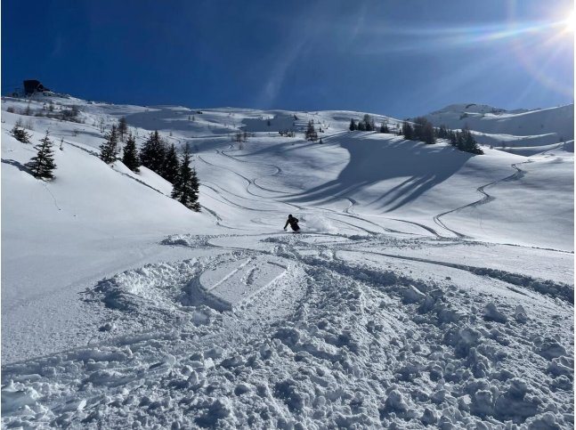
Freeride in Davos (s. 20.03.-24.03.)

nierbar) für Drei- und Vierbettzimmer mit Frühstück für 2x57€ pro Person.