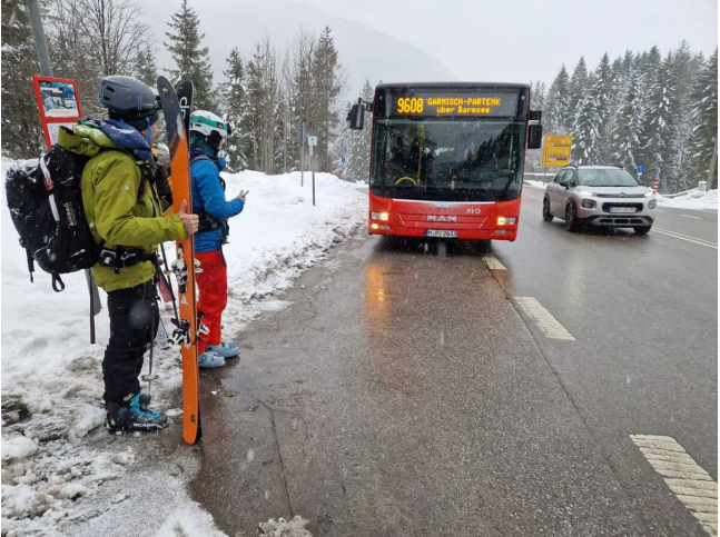
Unterwegs mit Ski und Öffis... (s. z.B. 20.01.)