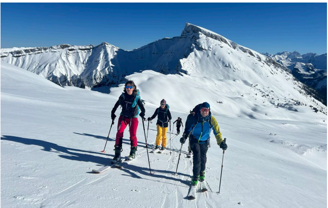
Unterwegs rund um den Hohen Ifen (s. 17.01.-19.01.)