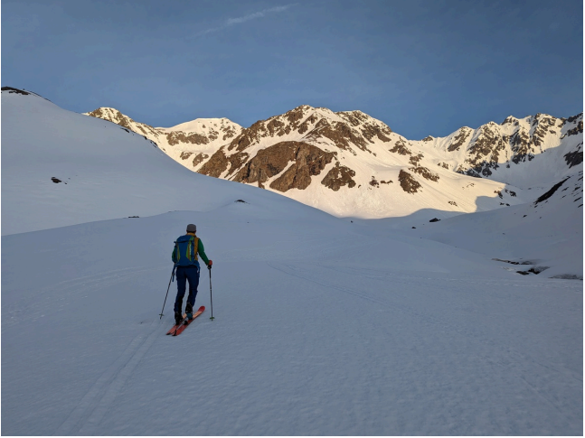
Auf dem Weg der Pforzheimer zum Zwieselbacher (s. 17.02.-22.02.)