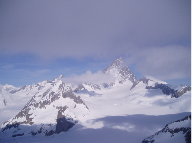
Finsteraarhorn (s. 30.04.-05.05.)

renleitern nicht bekannt sind, halten dort bitte vor der Anmeldung Rücksprache.