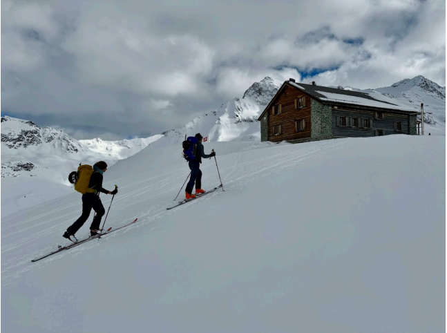
Die letzten Meter zur Jenatschhütte (s. 09.03.-13.03.)

grundsätzlich nordwärts, evtl. den Piz Radönt (3.065m) und das Schwarzhorn (3.146m) noch „mitnehmend“ ins Skigebiet von Davos. Oder in „Großrichtung“ Süden zunächst über den Piz Sarsura (3.178m), um dann ins Engadin abzufahren. Zurück zum Ausgangspunkt geht es mit ÖPNV